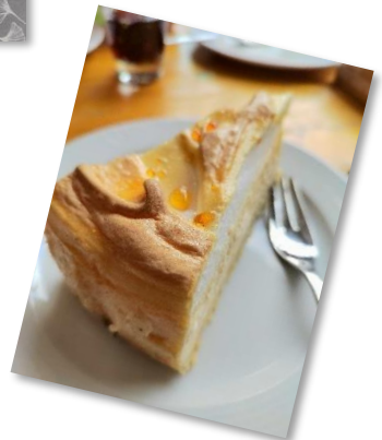
Bilder/Text: © H. Banik-Ladewig