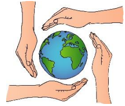
Bild: © Gaby Bessen und Grafik: ©: Birgit Seuffert | factum.adp - In Pfarrbriefservice.de

Diese Fragen laden ein, das Bild miteinander zu entdecken und so Teil einer neuen, weltumspannenden Schöpfungs-Erzählung zu werden.