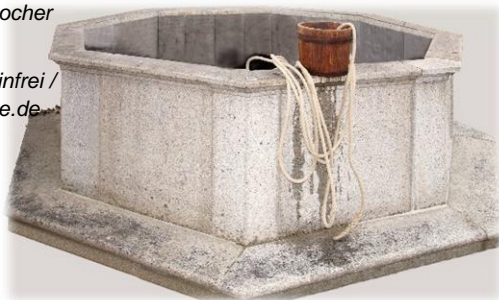
Foto Steinbrunnen © Martin Manigatterer In: Pfarrbriefsservice.de

Foto Glasflaschen © mrganso / cc0-gemeinfrei / Quelle: pixabay.com – In Pfarrbriefsservice.de