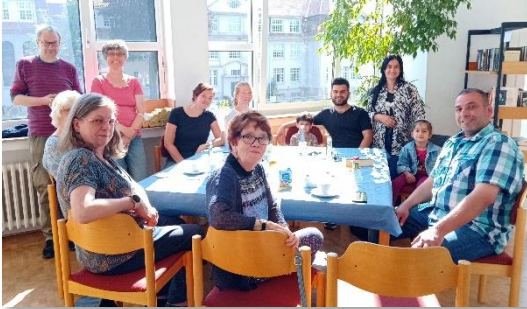
Mitarbeiter, Ehrenamtler, Gäste... Café Willkommen

durch Kinderbetreuung erweitert. Regelmäßig kamen 30 - 50 BesucherInnen wöchentlich, für Beratung, um Anschluss zu finden oder einfach zum Quatschen.