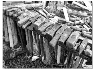
Text: H. Banik-Ladewig

Wir freuen uns über ein so engagiertes Team.