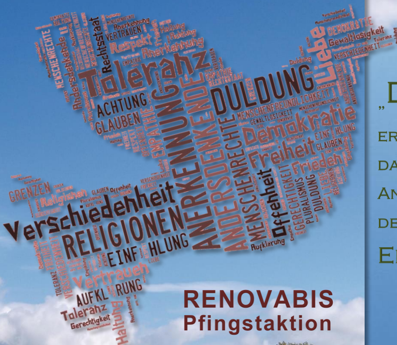
Bild: Klaus Kegebein - Taube; Tagxedo.com / CC-by-nc-sa 3.0 DE In: Pfarrbriefservice.de